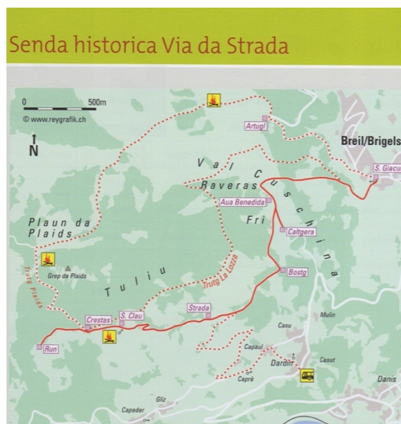
Broschura da viagiari en 2. ediziun