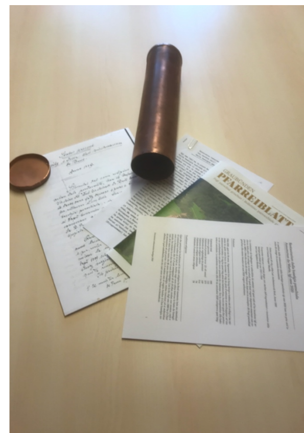
documents deponi ella cuppa d'iom

La cumissiun da baghegiar ei sedecidida da setener vid quei usit ed ha incaricau igl archivar dalla pleiv da redegger in text actual, il qual duei vegnir deponius ensemen cun copias da 1889 e 1964 ella rucla dil clutger. Plinavon duei era in exemplar dil Fegl parochial grischun dils meins fenadur ed uost 2020 vegnir aschuntaus.