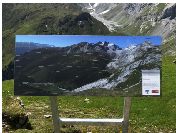
Tabla da panorama si Rubi-su

situaziun da pandemia ei quei deplorablamein buca stau pusseivel.