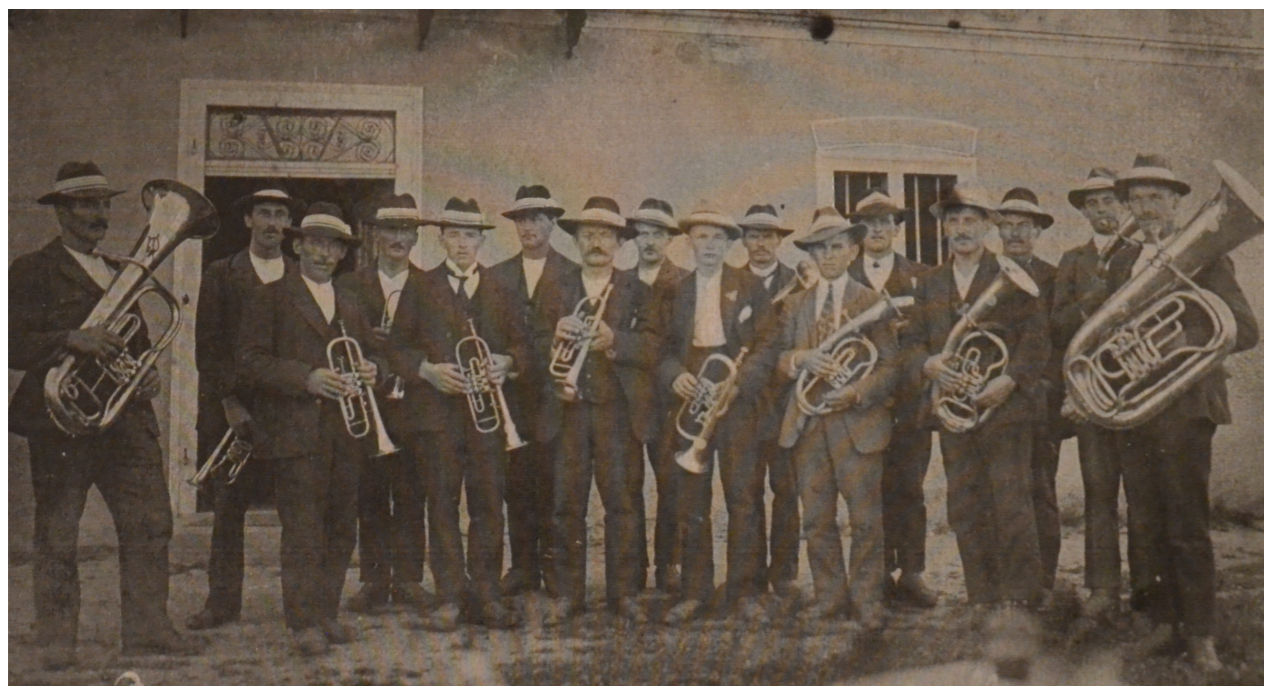
Societad da musica Danis-Tavanasa igl uost 1923