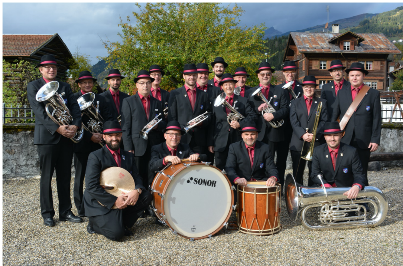
Societad da musica Danis-Tavanasa a caschun dalla Perdanonza da Rueun igl onn 2019

che gioga era ina impurtonta rolla el vitg ed en vischnaunca (concerts per giubilar, concerts annuals, produziuns a fiastas ecclesiasticas e profanas (p.ex. schibettas). La Societad da musica Danis-Tavanasa duei viver vinavon e per quei lein era festivar nies giubileum da 100 onns. Muort corona ha la societad da musica buca saviu festivar il 2020 siu anniversari. Il