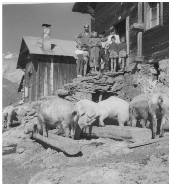
Ils pors dall'Alp Quader lain gustar la scotga, foto dils onns 1950

Il paster catschava la damaun la muaglia sin pastira, pertgirava e gudeva magari la biala vesta d'in crest anora. Denteren tunscheva ei da far in cupid en in fiep. Pil pli veva el cun el il buob da vaccas. Gronds muvels pretendevan era dus pasters. Oz ei tut semidau e las vaccas pasculeschan gronds territoris circumdai da seiv electrica. La sera vegn aviert la geina ed il muvel vegn catschaus en stalla per mulscher.