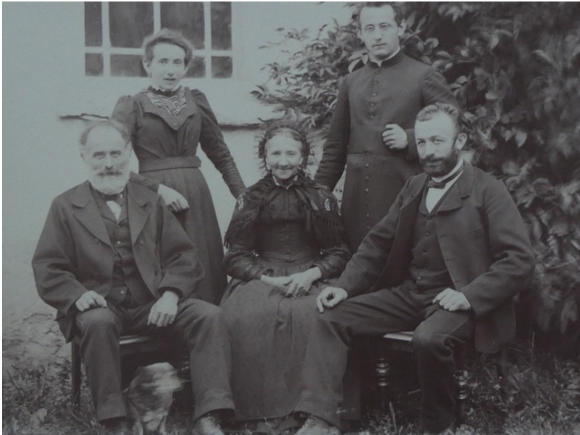
Famiglia Cahannes igl onn 1901