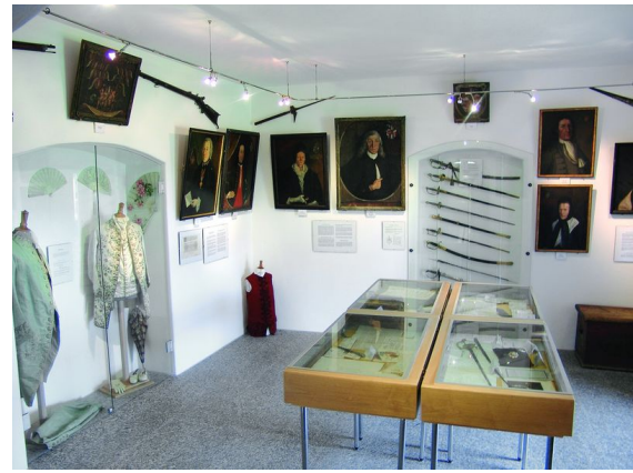
La stanza gronda dil museum

Culs onns ei la famiglia sesviluppada ad ina dinastia da politichers ed officiers seme-glionta allas famiglias de Castelberg da Mustér, de Mont da Vella ed autras.