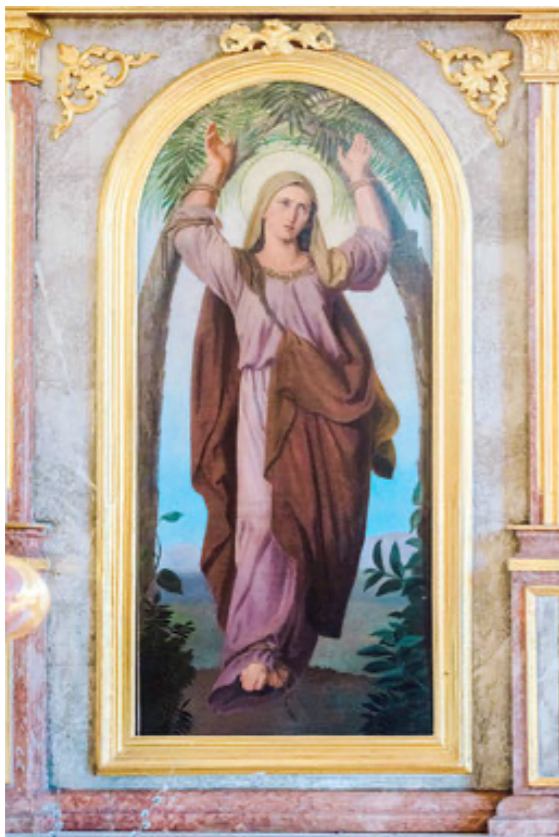
Baselgia da peleginadi St. Corona am Schöpfl Austria (foto)

torturaus e sentenziaus alla mort. Corona, sia feglia ni dunna, ei vegnida per consolar e dar curascha a Victor ed als auters schuldaus sentenziai. Cun quella caschun han ins era arrestau e sentenziu ella alla mort e lu mess vi ella a moda e maniera zun brutala. Corona ei vegnida ligiada culs mauns denter duas palmas sturschidas a plaun. Ed enten schar slantschar ad ault las palmas eis ella vegnida catapultada ad ault e siu tgierp scarpaus dapart.