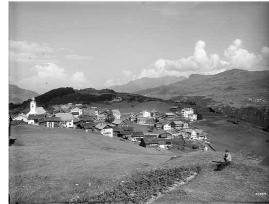
Vista sil vitg da Breil da 1905