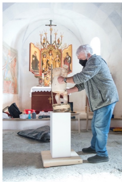
Sep Gabriel Poesia: La sera spel lag