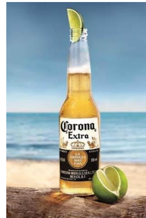
Reclama per la biera Corona.

Sco jeu han ils biars da nus strusch enzacu udiu enzatgei d'ina sontga Corona. Siu num ei denton dapi igl onn 1925 enconuschents sco marca per ina speciala sort d'ina gervosa mexicana, momentan exportada ed apprezzada en 180 tiaras. «Corona» ei da sias uras vegniu eligiu sco num per la gervosa en omagi dalla cruna (corona) roiala spagnola, en regurdientscha dalla conquista da Mexico entras la Spagna igl onn 1530 s.Cr.