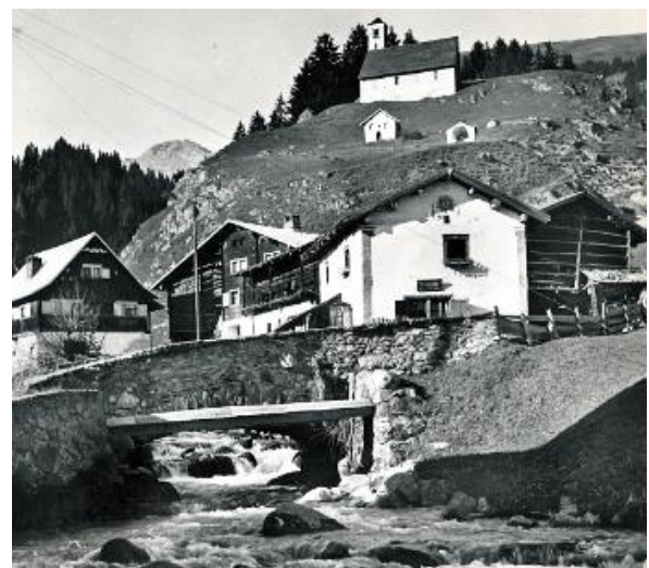
La „Punt romana“ sur il Flém enta Cuort.

La statua da Sogn Nepomuk sin la punt dil Flém ei fetg scardalida. Il Forum cultural ha previu da restaurar quella el decuors digl onn 2025 e cheutras dar niev anim a S. Nepomuk da protegger era egl avegnir il vitg da disgrazias.