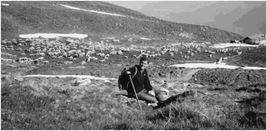
Gidonter Ciril fa in paus si Rubi Su.

denton la situaziun climatica e dall'aura ein mai tuttina. Gest quei cudezza da cuntinuar e resta per ils gidonters in eveniment singular. In liung di cun dabia variaziun va a fin. Staunchels dil strapaz e liung viadi, mo cun gronda cuntentientscha dalla gartegiada cargada semettein nus staunchels en cucca. - Igl ei stau bi!