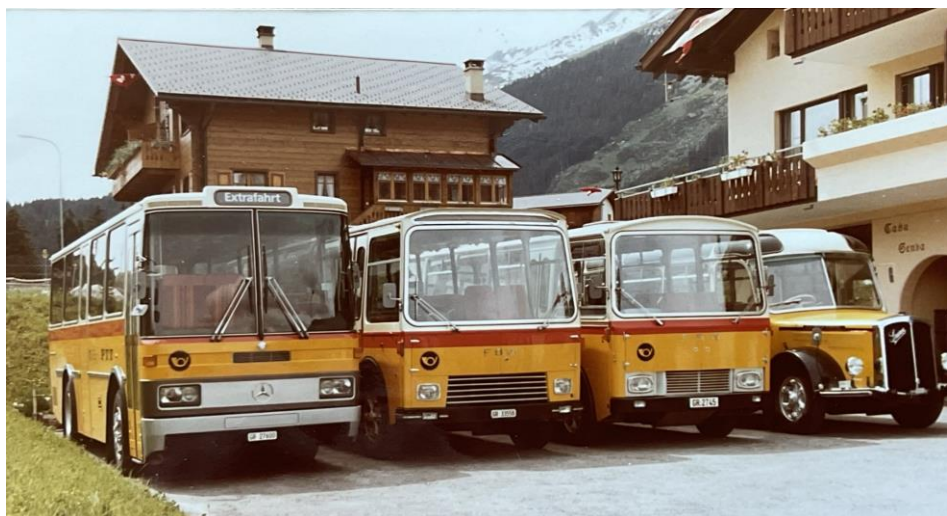
In Mercedes, dus FBWs ed in Saurer fan parada avon la garascha a S. Giacun.