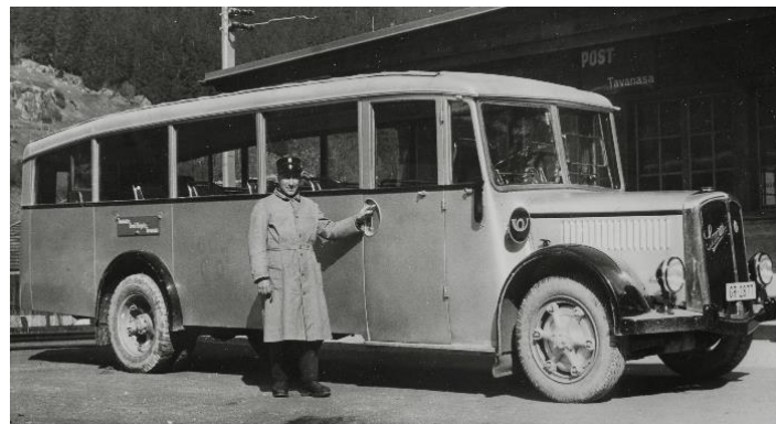
Theofil Bearth cul Saurer alla staziun da Tavanasa.

Muort igl augment da passagiers e posta tonscha ei buca pli da far ils cuors d'unviern dis da bia neiv cun vitturin e cavagl. Ei drova pia in auto cun dapli forza ch'el sappi era gest rumir la via dalla neiv. Ei vegn cumprau in Saurer dil tip CR1D cun 65 PS e 21 plazs da seser.