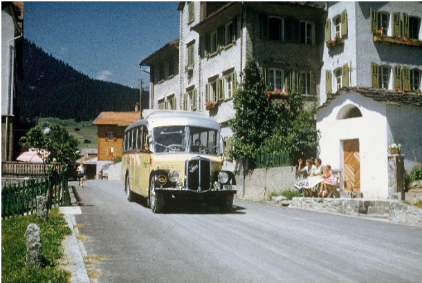
Il Saurer CR2D all'extrada da Breil 1958.

Igl ei bein interessant ch'ei dat strusch documents pertuccont l'avertura dil menaschi d'auto da posta sin la via da Tavanasa a Breil. Cun l'avertura dalla punt nova sur il Rein a Tavanasa ei il menaschi da posta cun automobil vegnius introducuis sin la via Tavanasa – Breil.