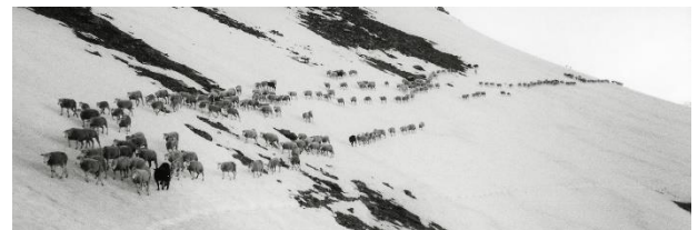
e traversan la plaunca malesgira viers il Plaun Lembra.