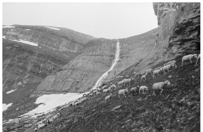
Las nuorsas sin viadi da Zanin viers Plaun Bials, il liug da rimnada.

Gievgia, ils 09 da fenadur ei stau rimnada dalla muntanera dall'entira vischnaunca. Il viadi fuva planisauus en duas etappas. Tras la Val Frisal vegn la muntanera catschada da Rubi Sut viers Rubi Su, in tschancun ualti teis. Encunter sera arriva la muntanera ella vischinonza dalla Camona Durschin, sisum Plaun Bials.