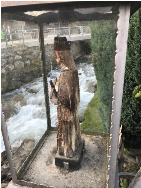
La statua da Sogn Nepomuc entadem il vitg.

A Breil entadem Cuort sin la punt veglia sur il Flém sesanfla ina statua da Sogn Nepomuk. Sogn Gion Nepomuk ei savens da veser sin statuas sper flums ed uals per preservar leu da tuttas disgrazias. Pil solit tegn el ina crusch en in maun e magari in det da l'auto avon sia bucca per significar il secret dil confessiunal.