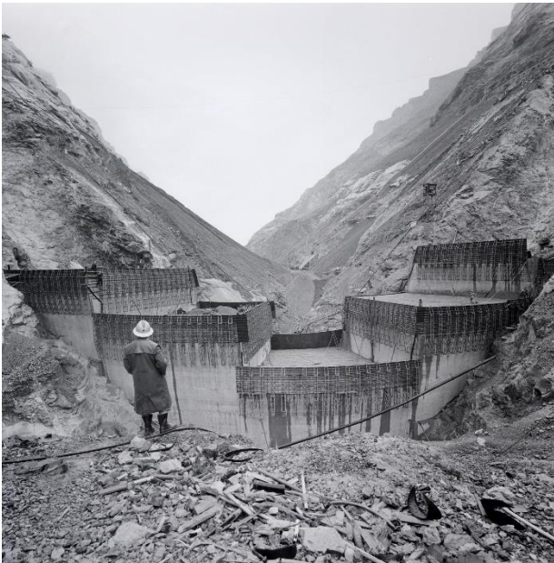
Duront la construcziun dil mir da fermada, october 1960.