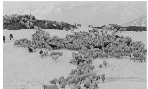
Las nuorsas contonschan igl ault dil pass ...

Danovamein ei semussau che mintga viadi on Lembra ei differentes. La via ei adina la medema,