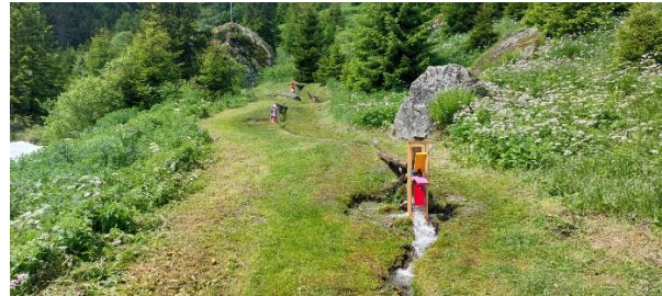
Rodas d'aua en Plaun da Pors