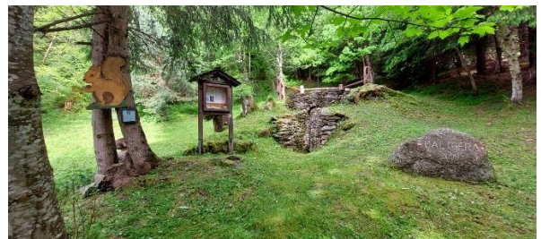
Caltgera a Favugn su, Dardin