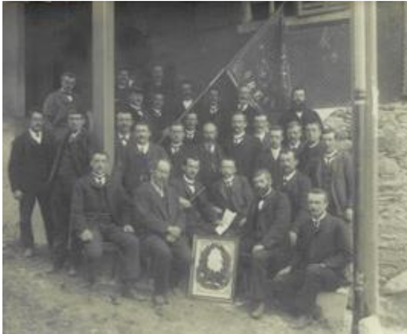
Chor viril Breil igl onn 1909

cant districtuala la fin d'avrel digl onn 1913. Il 10 da schaner 1913 surpren il chor viril l'organisaziun dalla XXI. Fiasta da cant districtuala che duei haver liug ils 27 d'avrel dil medem onn. La GR terminescha il rapport da fiasta: La fiasta ei stada biala ed emperneivla, grazia all'oreifra organisaziun e preparaziun cun agid dils habitonts da Breil, liug ideal per fiasta ideala!