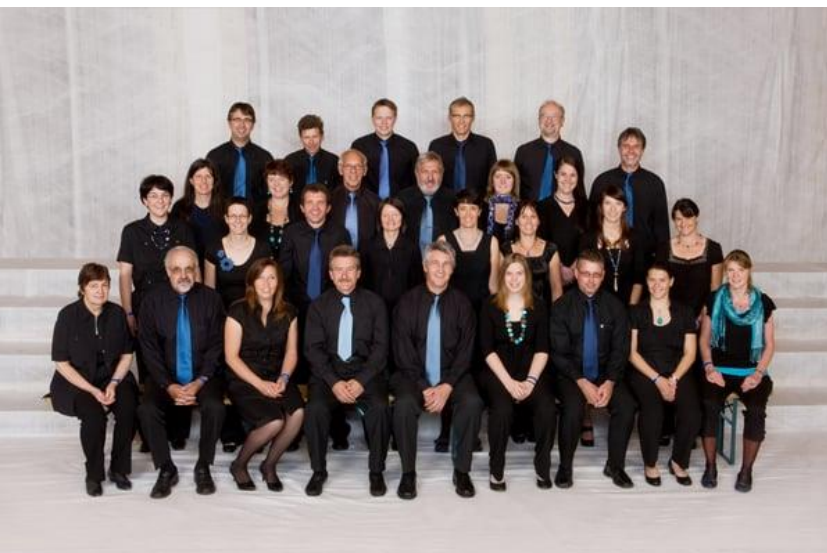
Fiasta da cant Glion 2011