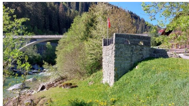
Pilaster Punt Maillart, Tavanasa