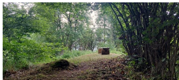
Baun sil Bostg sur Dardin