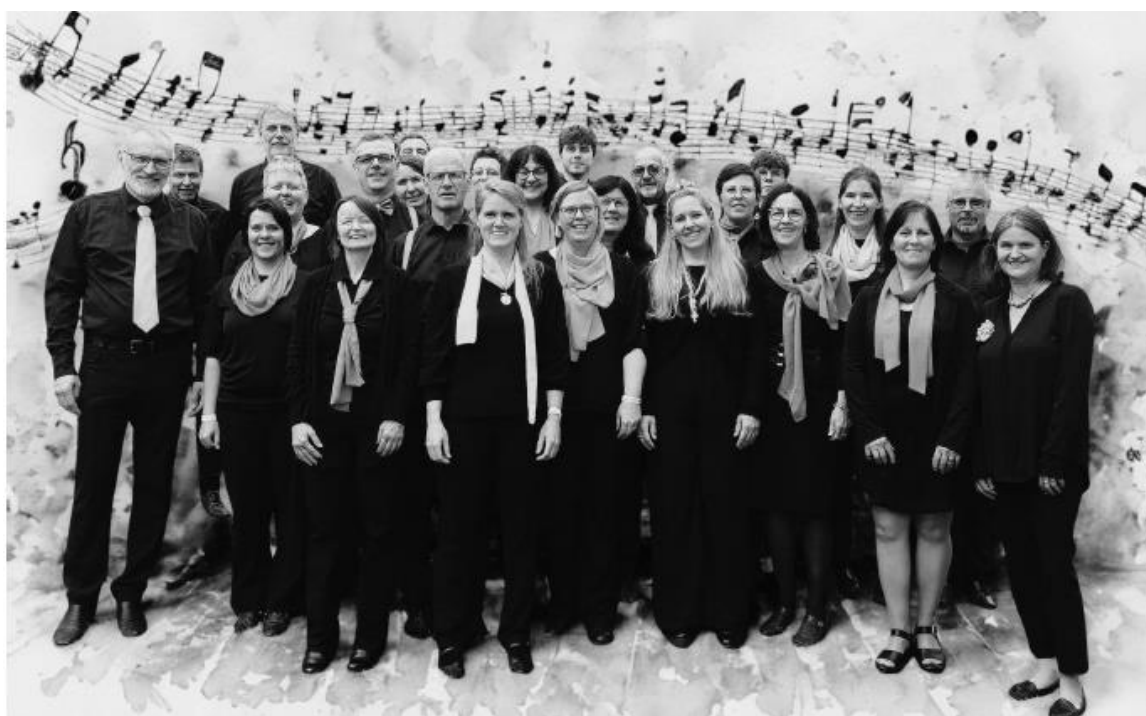
Fiasta da cant Trun 2024

A caschun da nies giubileum da 20 onns havein nus plascher da dar ina envesta els davos 20 onns dil Chor Uvriu e presentar il program da giubileum.