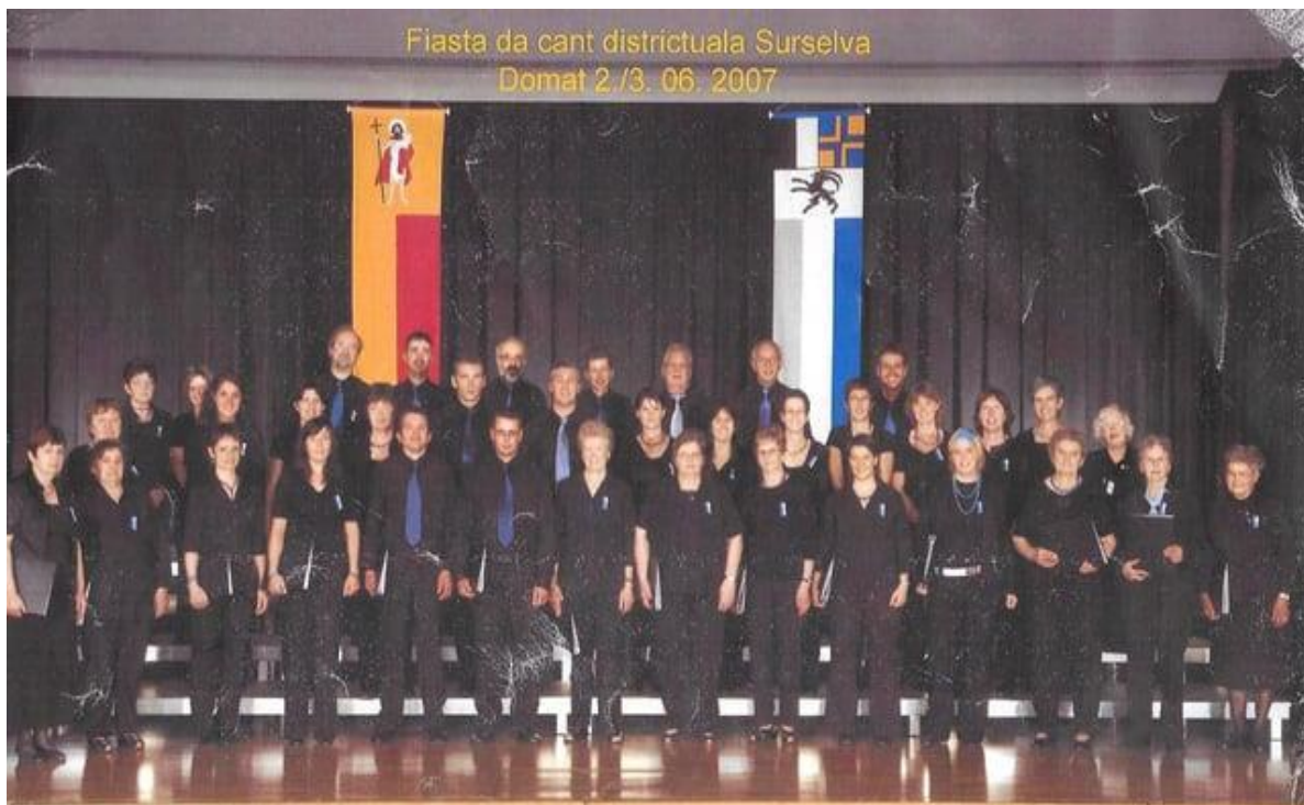
Fiasta da cant Domat 2007