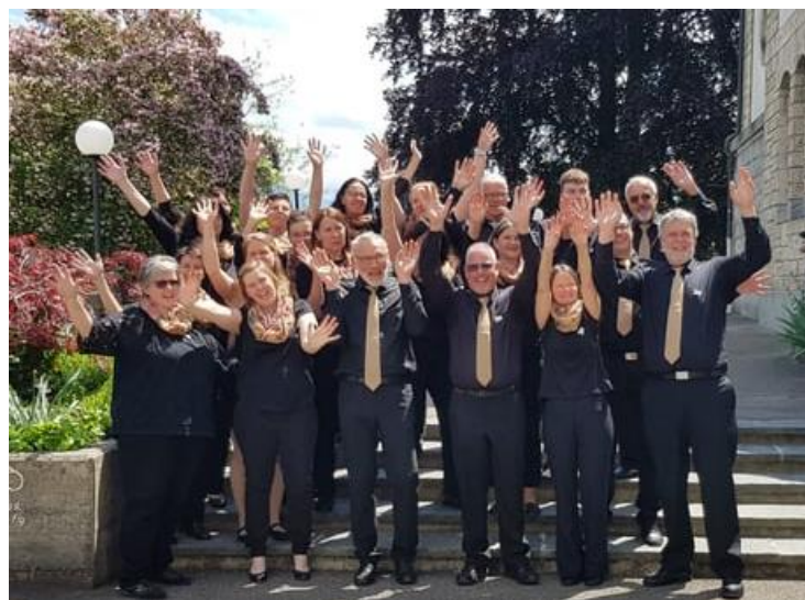
Fiasta da cant Gossau 2022